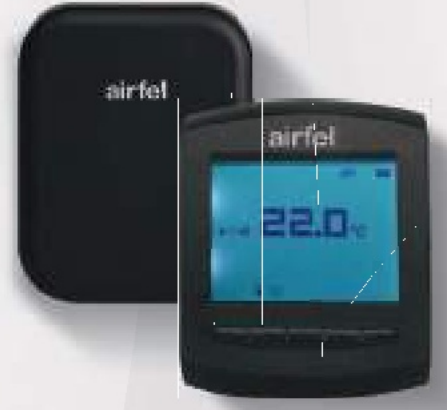
Kablosuz Airfel Scala Online Termostat