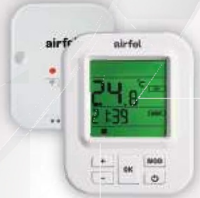
Kablosuz Otomatik Kontrol Cihazı